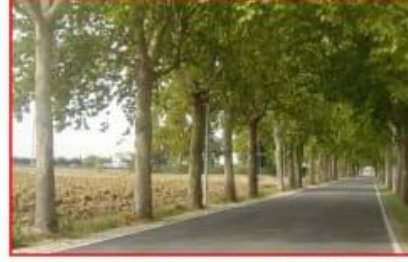
रोडच्या दोन्ही बाजूला असेल हिरवाई जिथे तुम्हाला मिळेल निसर्ग सात्रिध्याचा अनुभव ।