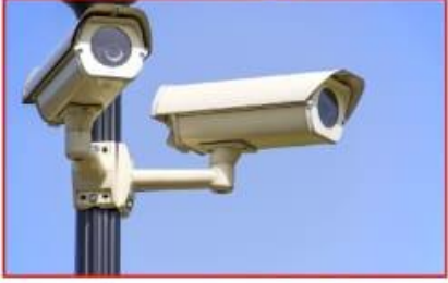
संपुर्ण प्रॉजेक्ट राहिल सी.सी.टी.व्ही कॅमेऱ्याच्या निगरानित जेणे आपण राहिल सुरक्षित