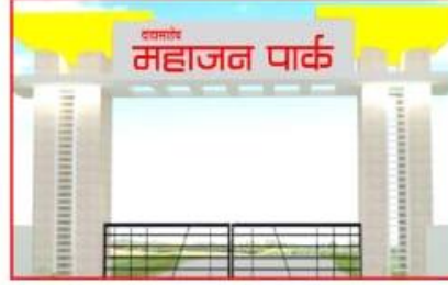
प्रॉजेक्टसाठी भव्य द्वार