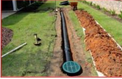
अंडर ग्राऊंड ड्रेनेज लाईन, सुप्रीम कंपनीचे आय.एस.आय. मार्क चे पाईप.