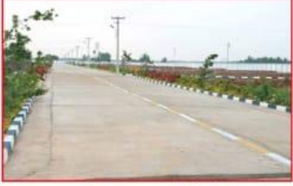
प्रशस्त आणि मोठ्या रुंदीचे सिमेन्ट रोड आता वाहतुक होईल अत्यंत सुसह्य ।