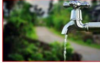
प्रत्येक प्लॉटचा नळ द्वारे पाण्याची सुविधा आता तुळी राहू शकाल निश्चित ।