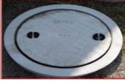
अंडरग्राउंड ड्रेनेज व चेंबरची सुविधा होईल पाण्याचा योग्य निचरा आणि तुम्ही राहाल टेन्शन फ्री ।