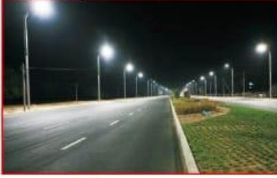
संपुर्ण प्रोजेक्टला असणार स्ट्रीट लाईट व इलेक्ट्रीक लाईन व व्यवस्था जी तुम्हाला देईल सुरक्षमी हमी ।