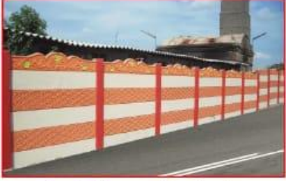
संपुर्ण प्रोजेक्टला वॉल कंपाउंड यामुळे तुमचं घर राहिल परिसर राहिल सुरक्षित ।